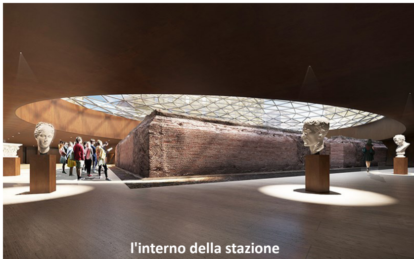
l'interno della stazione