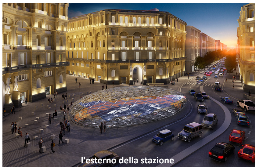
l'esterno della stazione

E' proprio vero che Napoli non smetterà mai di sorprenderci .